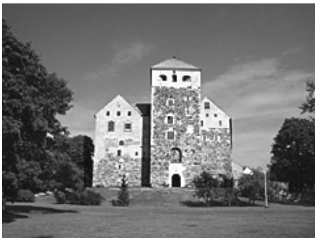
Kuva 2. Nykyinen tilanne. Bild 2. Nuvarande situationen.